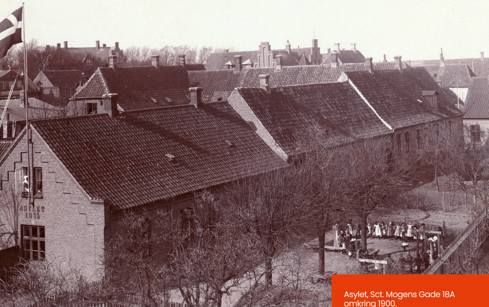
Asylet, Sct. Mogens Gade 18A omkring 1900.