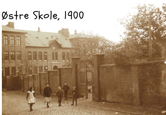
Østre Skole, 1900

Den første danske børnelov vedtages. Loven fastslog statens ansvar i tilfælde, hvor forældre ikke kunne eller ikke ville sørge for ordentlig omsorg for deres børn.