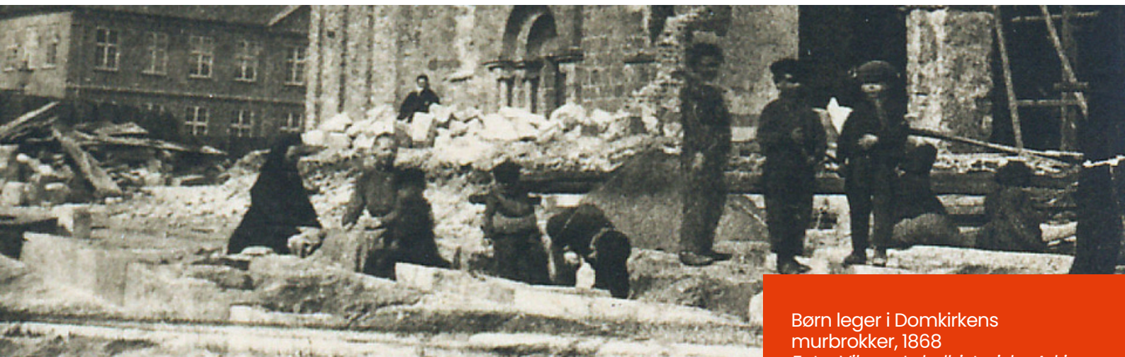
Børn leger i Domkirkens murbrokker, 1868