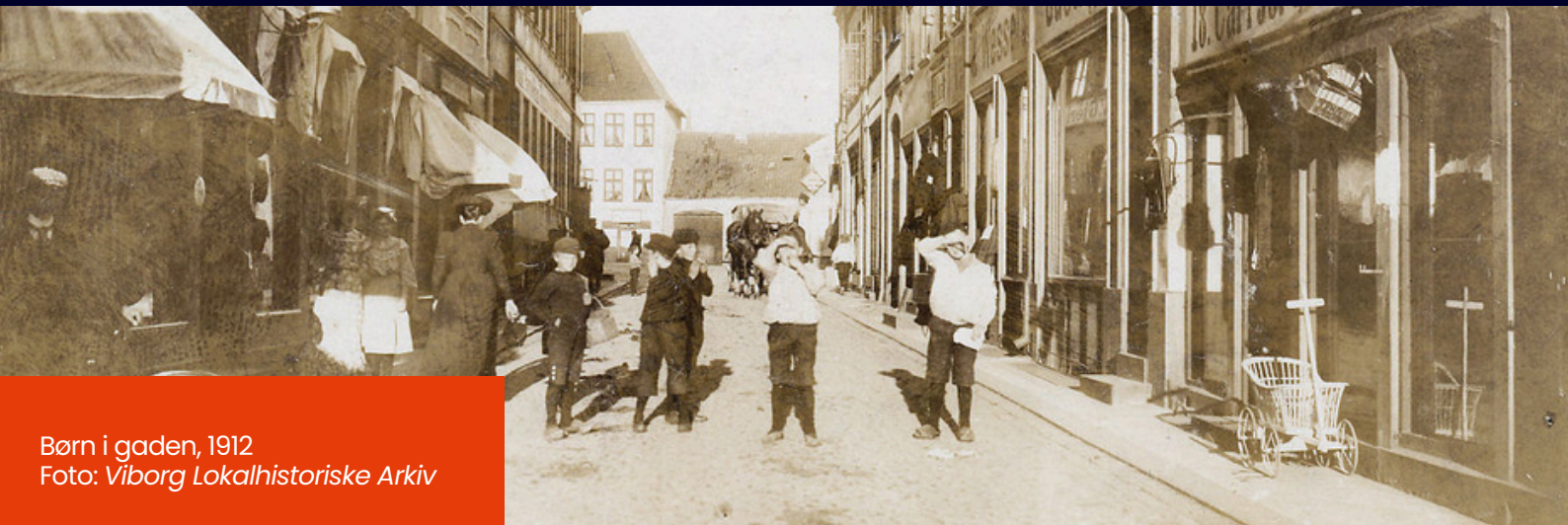
Børn i gaden, 1912

I 1875 startede Sct. Mogensgades asyl i Viborg, og det blev begyndelsen på en helt ny hverdag for småbørn i byen. Asyl er en slags børneinstitutioner for de 2-7-årige, havde længe eksisteret i andre dele af landet. Det første blev faktisk etableret i København allerede i 1828. Børneasyl er steder, hvor børn fra fattige familier kunne være. Et alternativ til at hænge på gaden eller blive låst inde derhjemme, mens forældrene var på arbejde