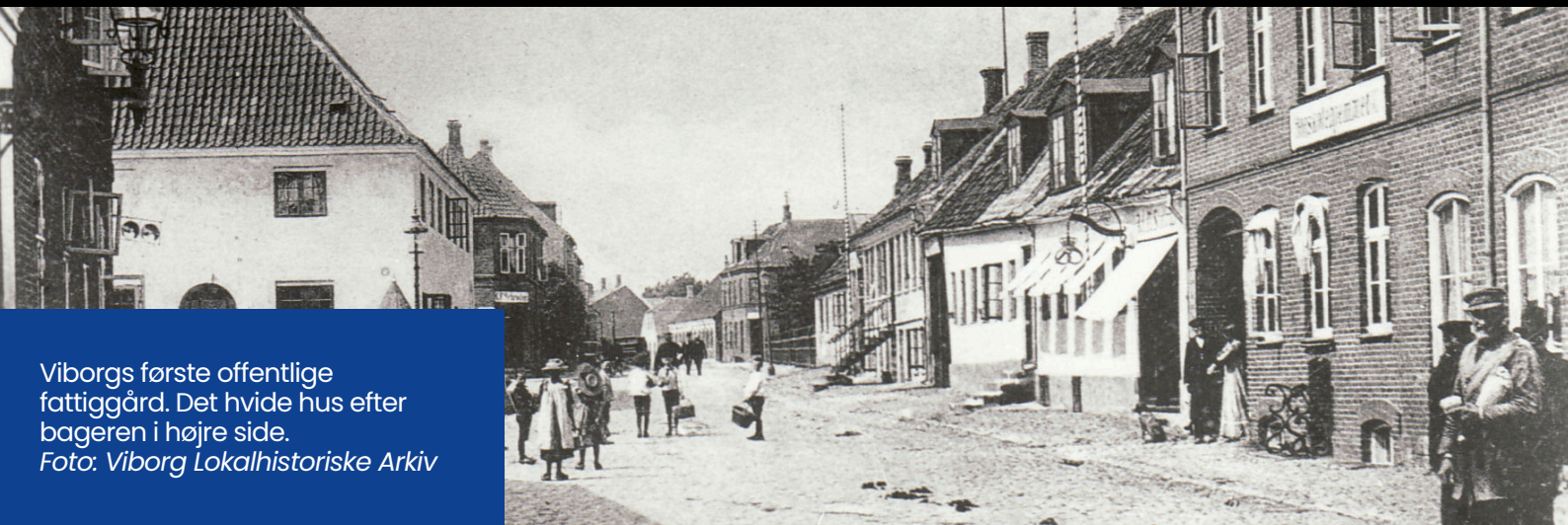
Viborgs første offentlige fattiggård. Det hvide hus efter bageren i højre side.

Har du nogensinde tænkt over, hvordan måden vores samfund fungerer på, påvirker, hvor meget frihed vi har til at træffe vores egne valg, og hvordan vi passer på hinanden?