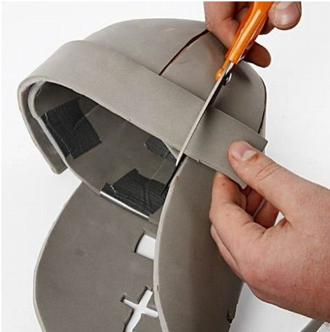
Step 9. Klip overskydende ender af.