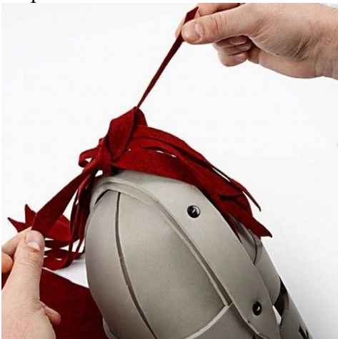
Step 23. Bind nu de resterende filtband fast med det monterede band.