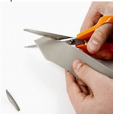
Step 11. Tag et ekstra bånd, og klip den spids i enderne.