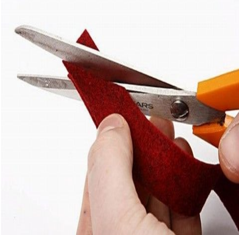
Step 19. Spids enderne.