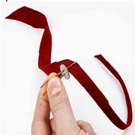
Step 20. Tag en af strimlerne og træk den gennem en "nitte" som vist.