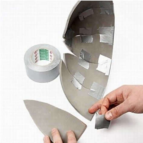
Step 3. Sæt trekanterne sammen med lærredstape som vist på billedet.