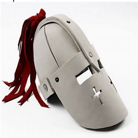
Step 25. Den færdige Hjelm.