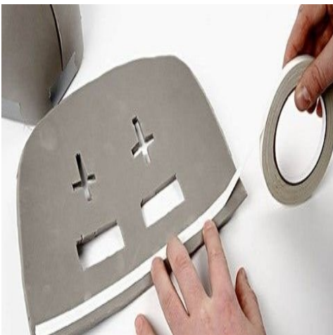
Step 4. Brug dobbeltklæbende tape til at fastgøre ansigtspladen på hjelmen.