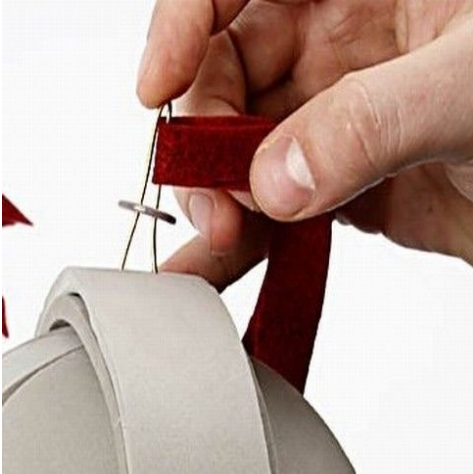
Step 21. Monter den så på toppen af hjelmen.