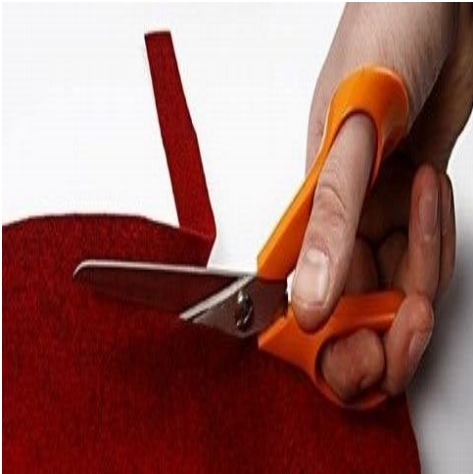
Step 18. Klip en 6-10 strimler (cirka: 1x50 cm) i filt til hjelm pryddelse.