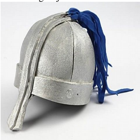
Variant af hjelm.

Denne variant er lavet uden visir, kun med en næsebeskytter, og malet med Plus color hobbymaling. -Hjelmen er malet i to omgange, første gang for at dække, og så duppet en gang med skumstempel for at opnå struktur.